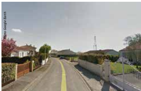
La rue des Colinettes avant... ▲ ...et après ▼